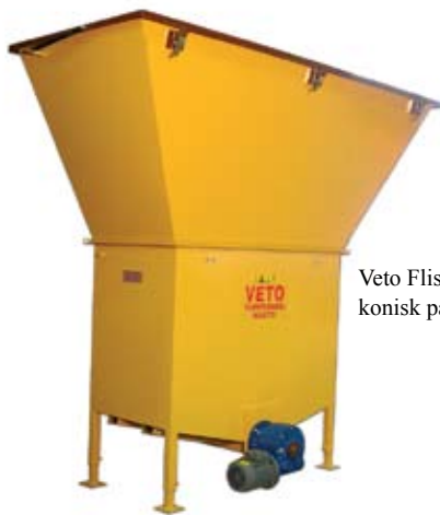
Veto Flisomat med 1,75 m 3 konisk påbyggnadssilo