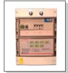
A-T Log 1 är en logikstyrd styrcentral

Bröderna Ala-Talkkari AB har över 50 års erfarenhet av tillverkning av värmeanläggningar för fasta bränslen. Fabriken är med i ett omfattande samarbetsprojekt för produktutveckling inom området och har medverkat i det ända från början. Flisomat är resultat av detta samarbete som fokuserar på att framställa anläggningar som är lätta att sköta. Brännaren (stokern) dockas till pannan och styrs av panntemperaturen, på liknande sätt som en oljebrännare. Den eldas med flera olika fasta bränslen, såsom flis, torv, pellet, briketter eller spannmål. Anläggningarna är testade enligt EN-303-5 (Vakola, VTT, BLT, Wieselburg, SP, Teknologisk Institut). I leveransen ingår en styrcentral med logikenhet, sprinkler, flammvakt, matarrörets överhettningstermostat och säkerhetsbrytare.